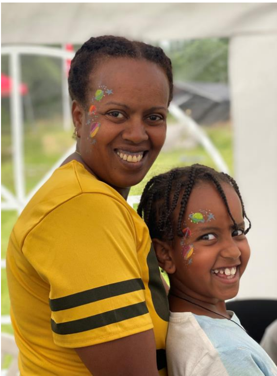
«Mamma og jeg har det gøy sammen på leir» 2022